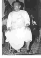
मूर्खता पीबि कऽ विषवमन करैत अछि समीक्षक - जीवकान्त